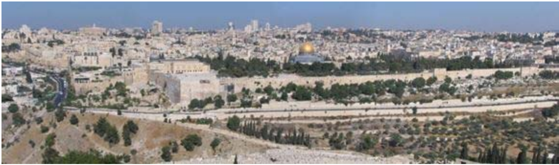
—オリーブ山から見たエルサレム—

この地上においてご自身の名を置かれるために、唯一選ばれた永遠の都です。「エルサレム」は神の主権によって建てられる都であり、そのために用いられる人々の存在があったとしても、決して人間の力によって建てることのできない都なのです。それゆえ、「主が家を建てるのでなければ、建てる者の働きはむなし。主が町を守るのでなければ、守る者の見張りはむなし。」(詩篇 127:1)と語られているほどです。